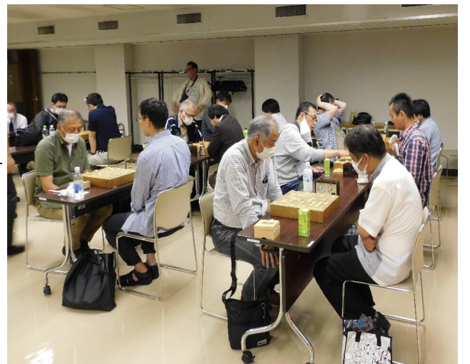
熱戦を繰り広げる参加者たち