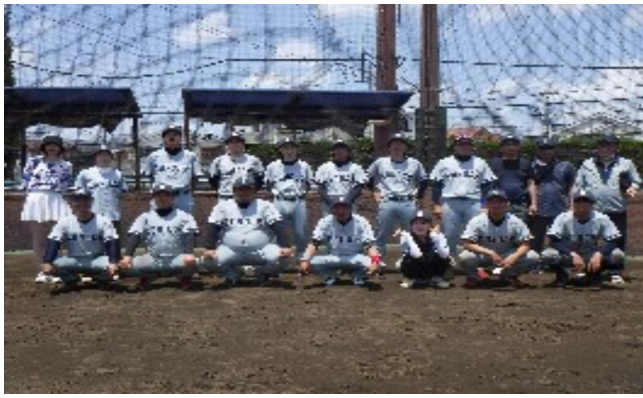
優勝チーム 全コンドル労組

昨年6月21日、開幕戦から14チームが参加して戦われた全自交東京地連第1回野球大会は、全コンドル労組と日交労赤羽支部が勝ち抜き決勝へ進出。7月4日、好天に恵まれ笹目公園野球場にて決勝戦が行われました。熱戦の末、全コンドル労組が日交労赤羽支部を10対9で日交労赤羽支部を破り全コンドル労組が全自交東京地連初代優勝